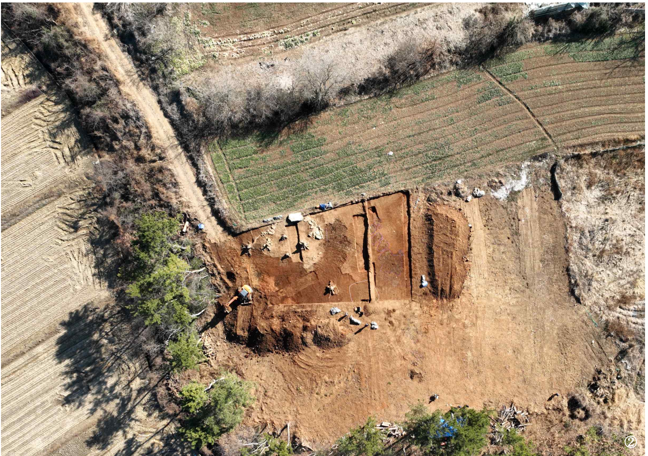
【사진 1】 정밀발굴조사 후 전경(①원경(동→서), ②직상방)