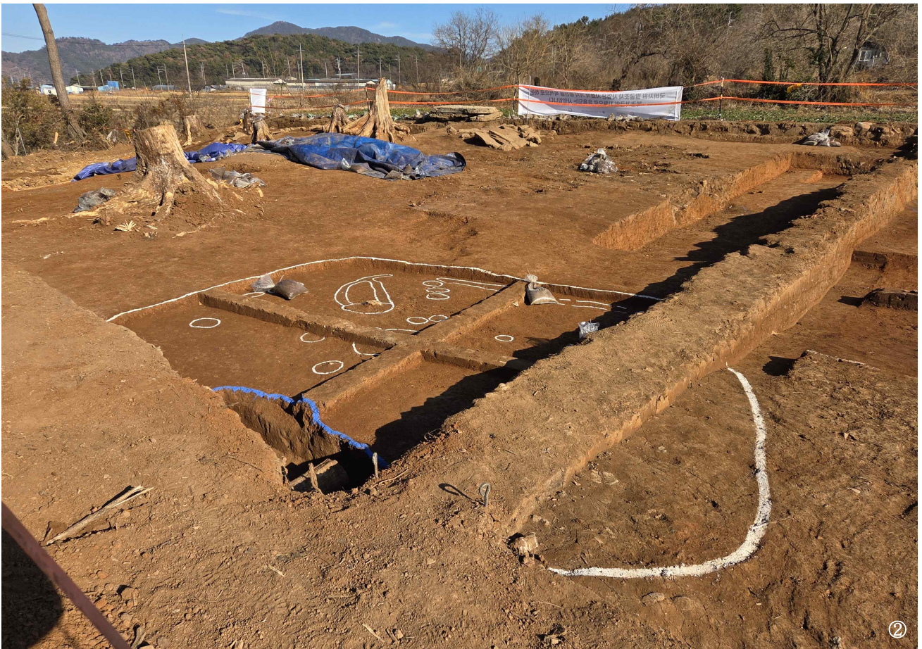
【사진 2】 조사 전경(①청동기시대 지석묘와 묘역시설, ②청동기시대 주거지)